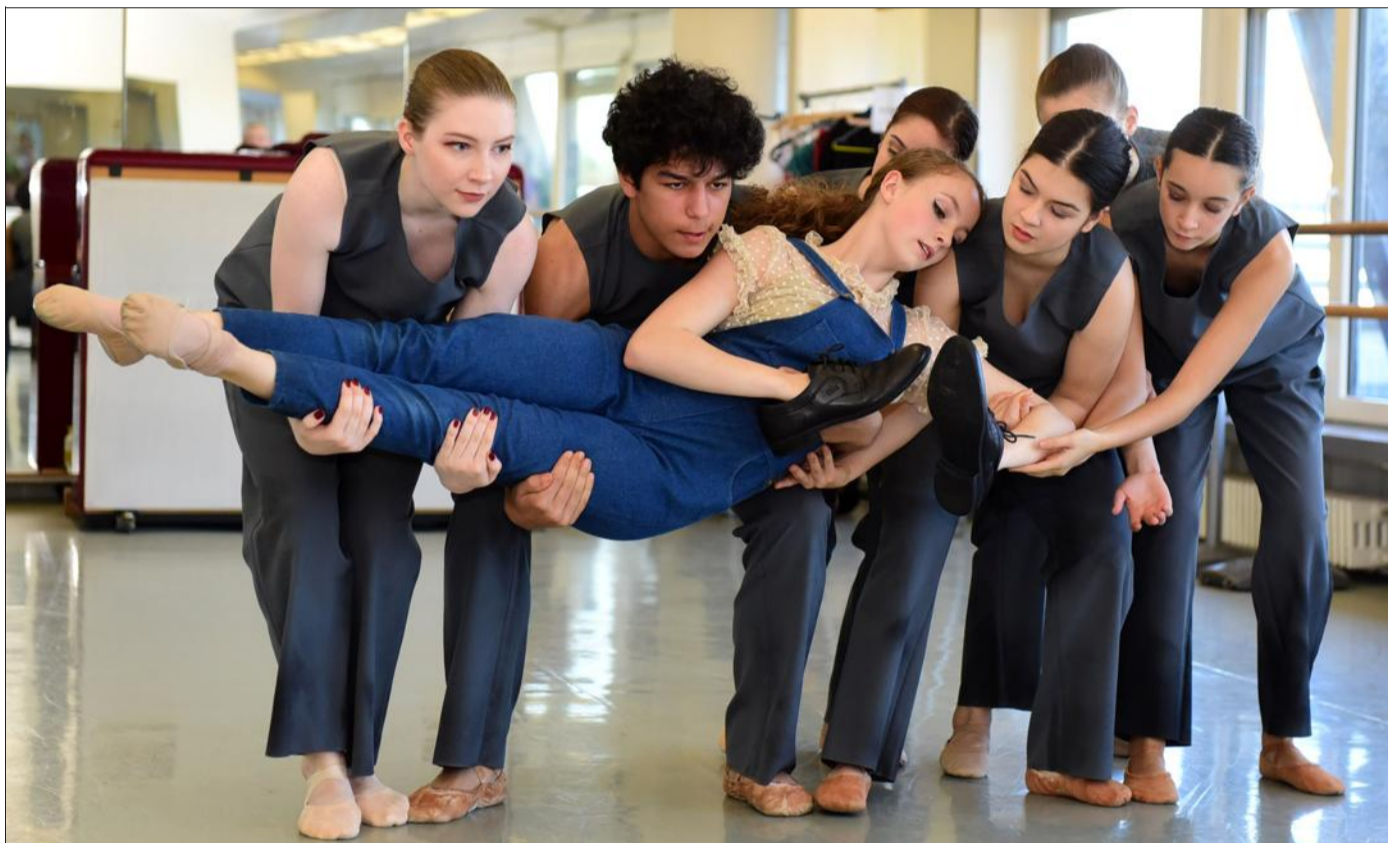
Les répétitions finales vont bon train à Bâle pour « Cendrillon » mis en scène par Anna Vita.

Comme pour beaucoup d'histoires appartenant avant tout au patrimoine oral, l'histoire de Cendrillon varie beaucoup à travers les époques et selon les pays. En ce sens, le travail de création d'Anna Vita, qui met en scène l'histoire de Cendrillon dan-