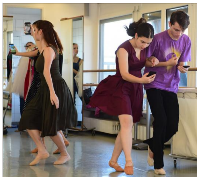
Le prince cherche une princesse, la nouvelle se répand à toute allure sur les réseaux sociaux.

PLUS WEB Voir notre diaporama sur www.lalsace.fr